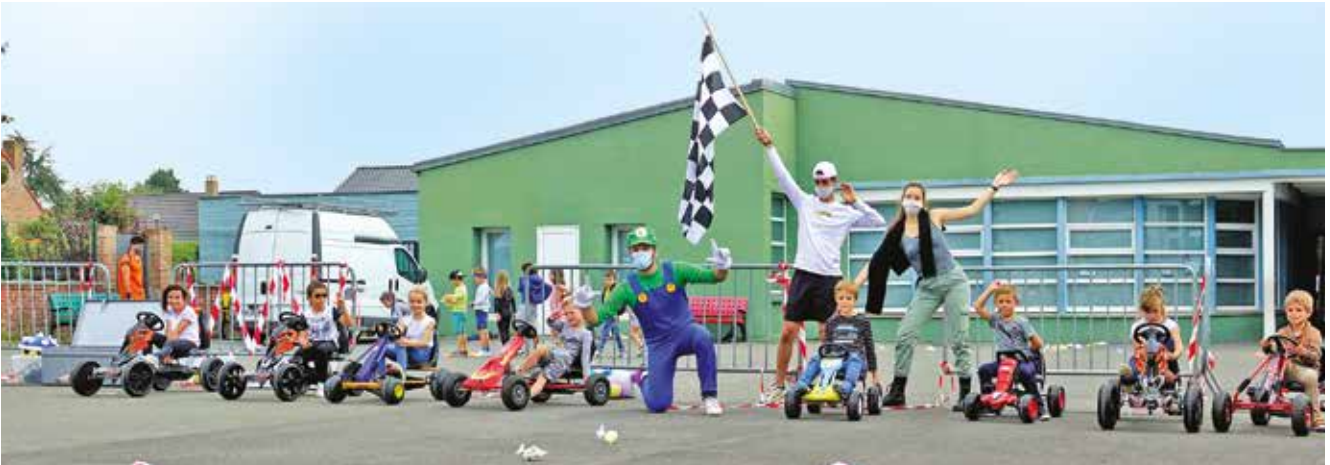
Un karting façon Mario Bros : à vos marques, prêt, partez !