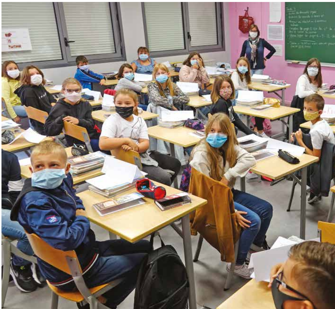
Une rentrée particulière : masque obligatoire pour tous les élèves du collège Alphonse Daudet.