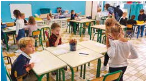
École Alice Cotteaux.