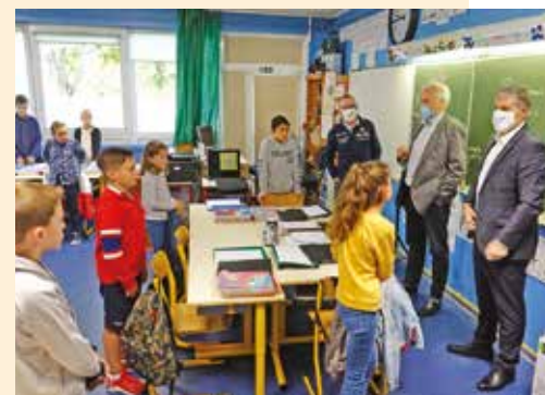
Visite des élus, ici, à l'école Léonard de Vinci.

Installation de stores anti-vision côté rue dans 4 classes. Coût : 6 000 €