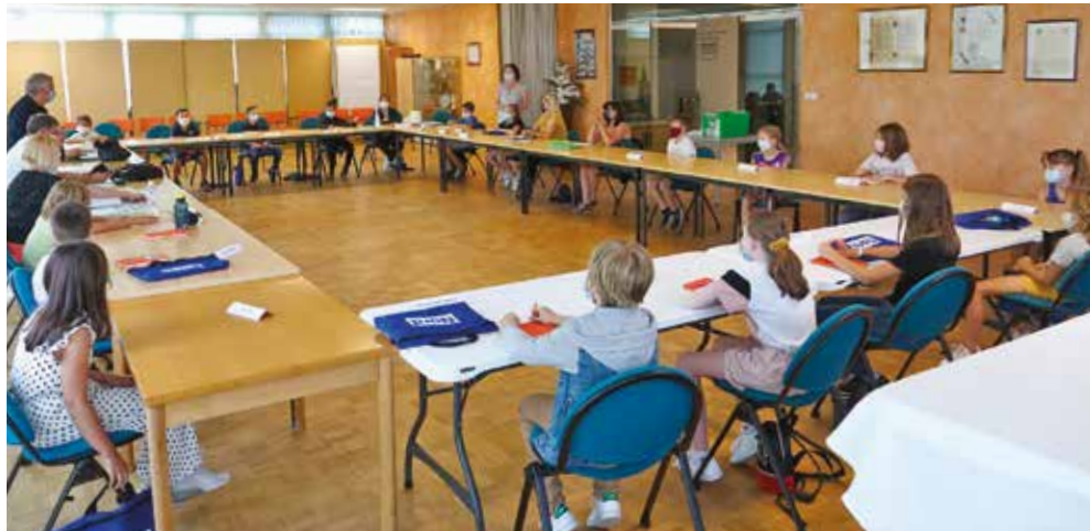
Le CMJ a relancé les projets en attente.

Pour raisons de confinement puis de vacances d'été, le Conseil Municipal des Jeunes avait dû interrompre ses activités durant plusieurs mois. Plus motivés encore, les jeunes se sont remis à l'ouvrage pour échanger et s'impliquer sur des sujets qui leur tiennent à cœur. Quatre thèmes... les gestes barrières, l'écocitoyenneté, les repas scolaires et le skate-park... ont occupé les échanges de cette séance de reprise.