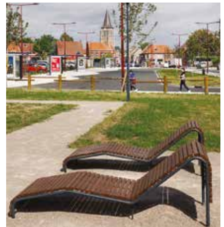
Des liseuses pour la détente.

La configuration permet une belle mise en valeur de la nature. Espérons que chacun saura respecter le nouvel équipement qui sera dénommé prochainement. N'hésitez pas à participer au choix du nom par le biais de la question participative (voir page 2).