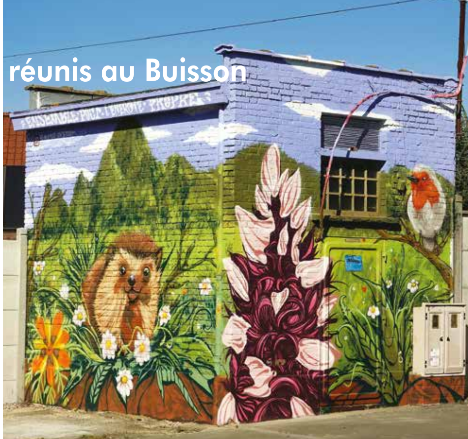
Le poste de distribution électrique embelli.

Pour mener à bien leur action, la Maison des Jeunes a fait appel à un artiste graffeur