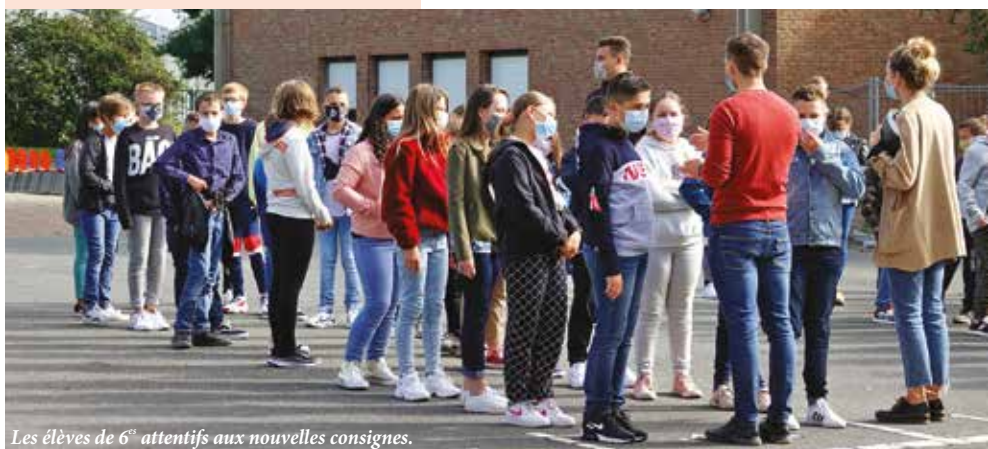
Les élèves de 6 e attentifs aux nouvelles consignes.