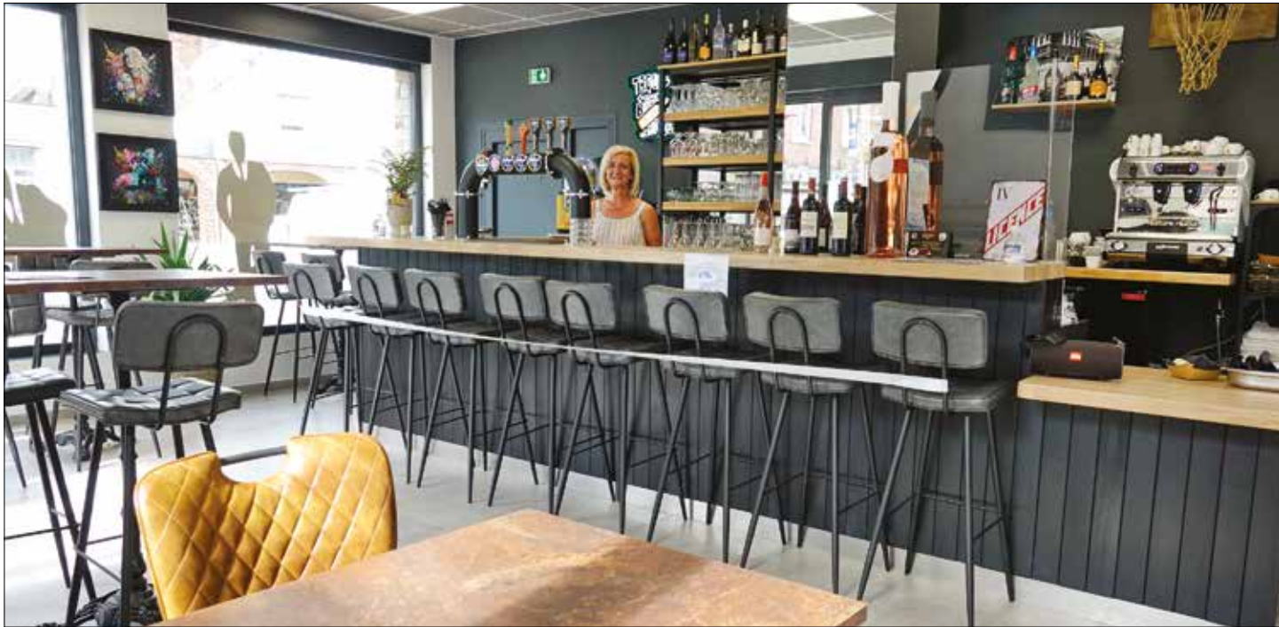
Un nouveau bar au design actuel.

Le nouveau café situé rue des Patriotes a ouvert le 20 août dernier. Le patron qui est aussi le poissonnier de Leers, a voulu un espace convivial, contemporain et accueillant. Défi réussi !