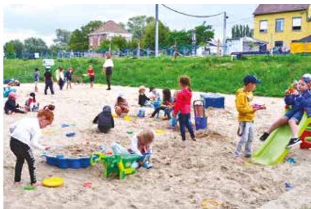
Sortie à Canal-Plage (à Leers-Nord) pour les Poussins en août.