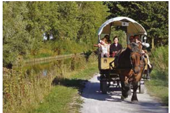
La balade en roulotte, un moment détente et nature très apprécié en ce dimanche ensoleillé !