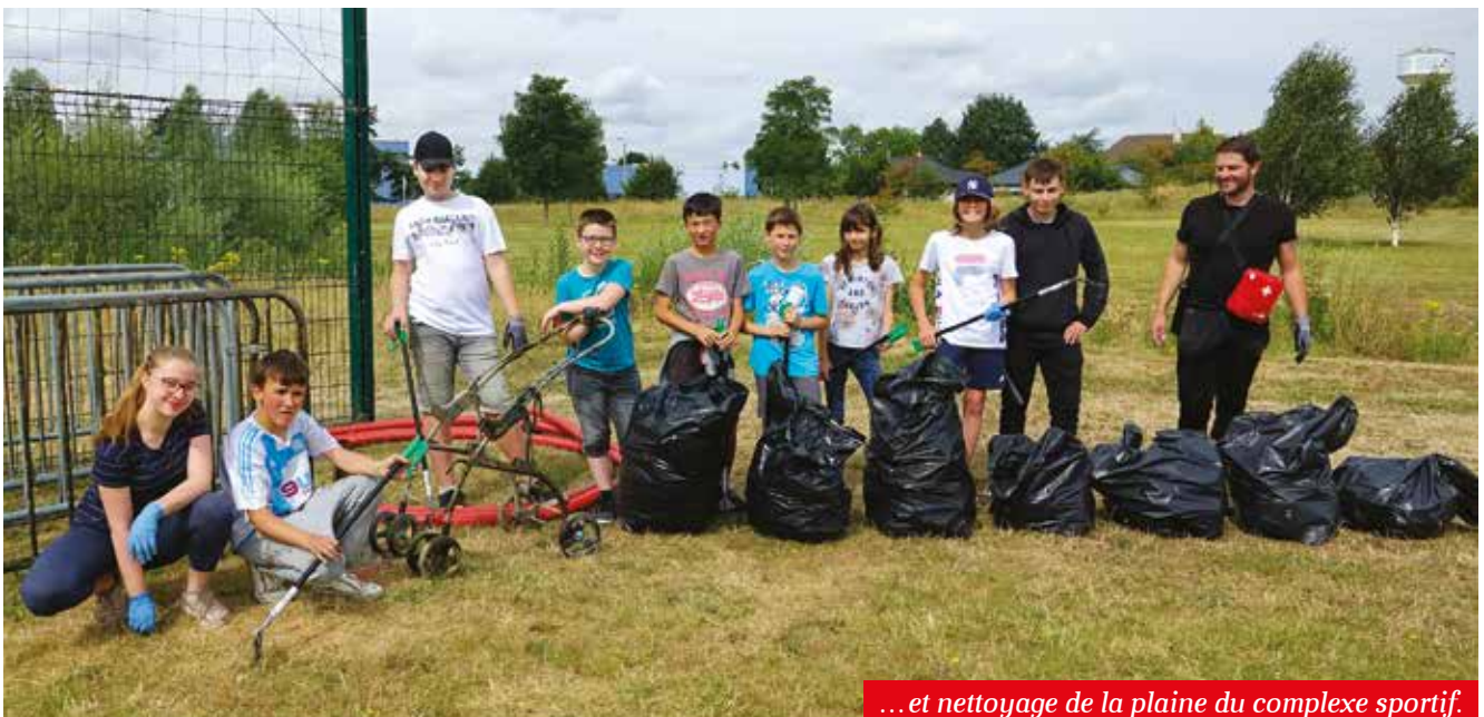
...et nettoyage de la plaine du complexe sportif.

Sport, sorties originales, activités manuelles, jeux, fêtes, campings... les enfants et adolescents n'ont pas eu le temps de s'ennuyer durant l'été... voici un extrait de l'album photos des meilleurs moments !