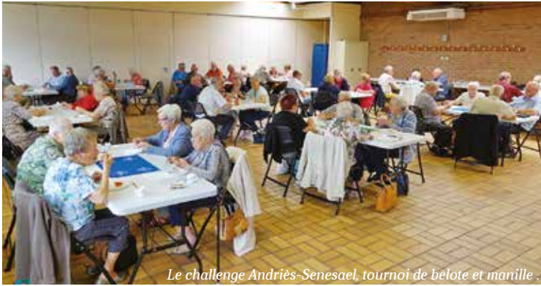
Le challenge Andriès-Senesael, tournoi de belote et manille.

Du 13 au 15 septembre, le soleil était au rendez-vous pour accompagner les festivités organisées de part et d'autre de la frontière à l'occasion du 34 e anniversaire de jumelage entre Leers et l'entité d'Estaimpuis. Dans une ambiance conviviale, les animations se sont enchaînées tout le week-end : tournoi de cartes, soirée des Jeunes talents, brocante, activités proposées par la confrérie des Satcheux, balades en roulotte, laser-game au parc de la Butte, concours de pêche et de pétanque, arts en liberté, brevet cyclotouristes, repas à la ferme ... Un programme des plus variés !