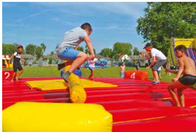
Après-midi jeux gonflables pour les Pandas en août.