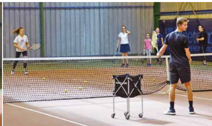
Entraînement des jeunes.