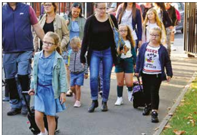
De la maternelle au collège, 1522 élèves ont fait leur rentrée à Leers.

Accueils de loisirs d'été Fin de mandat et nouvelle élection pour le CMJ Rentrée scolaire Un nouveau principal au collège