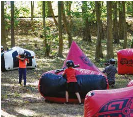
Jeux gonflables à la Maison du canal (B) et à La Guinguette (F) et laser-game pour les plus jeunes.