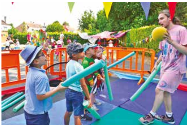
Kermesse des Poussins en juillet.