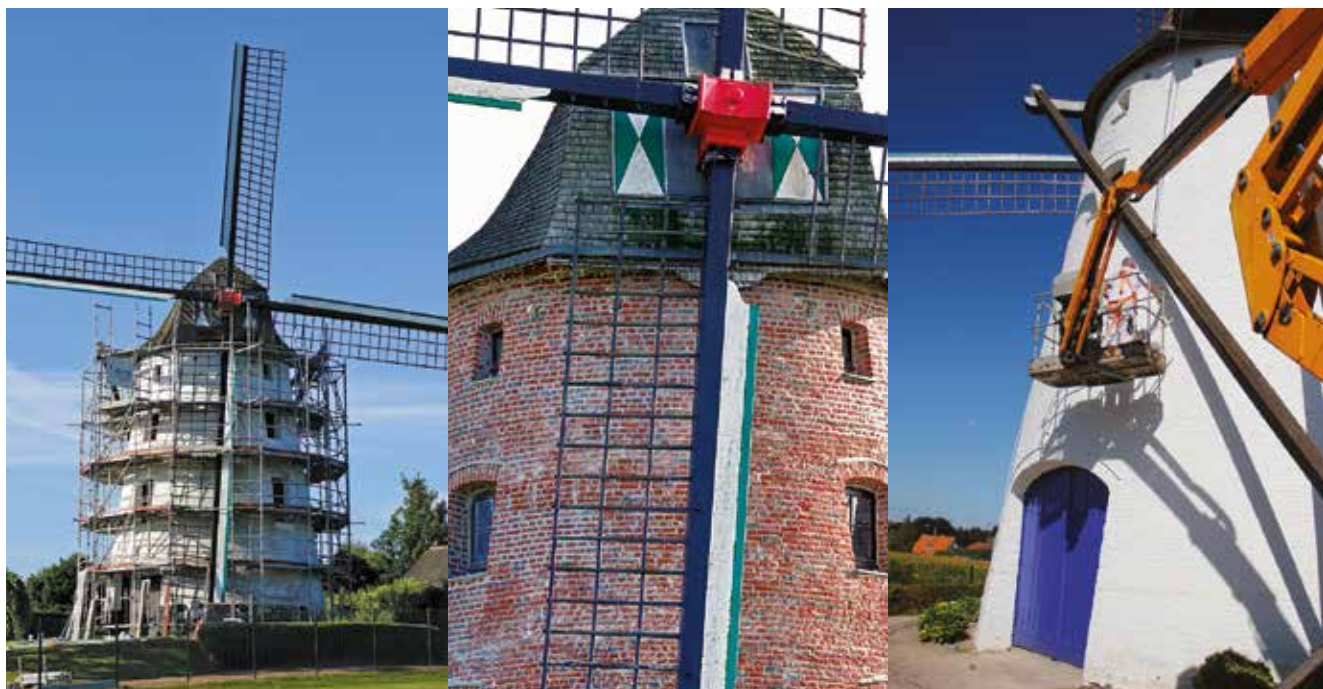
La restauration du moulin : enlèvement des couches de peinture par sablage, traitement de la brique, application de la nouvelle peinture et finitions.

L'édifice fait l'objet d'une remise en peinture tous les quatre ans environ. La dernière remonte à 2015 : façade et ailes avaient été repeintes pour les 40 es fêtes du Moulin. Cette fois, le moulin a bénéficié d'un nettoyage en profondeur. Un sablage de la façade a été réalisé pour ôter les couches de peinture successives afin de procéder à une remise en état des murs et des joints dégradés.