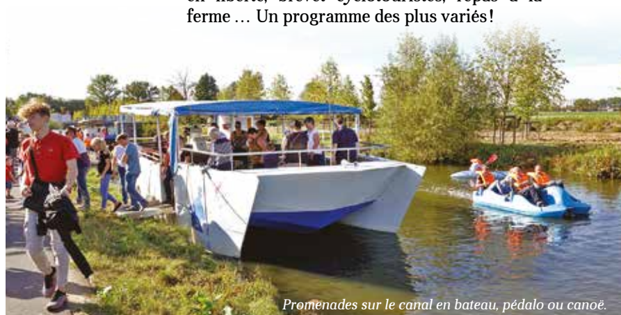
Promenades sur le canal en bateau, pédalo ou canoë.