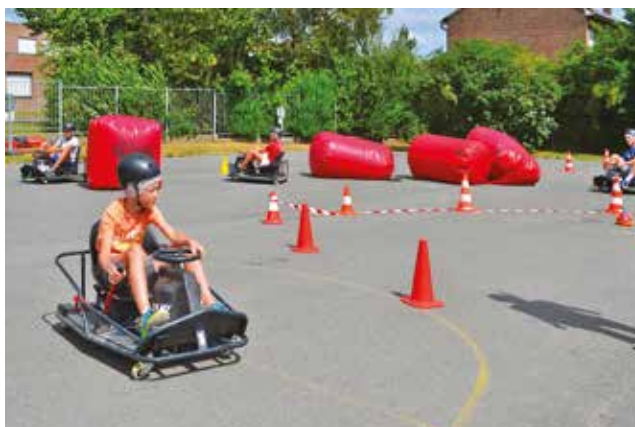
Après-midi karting pour les Lions en juillet.