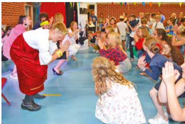
Soirée pyjama et spectacle pour clôturer le centre des Renards.