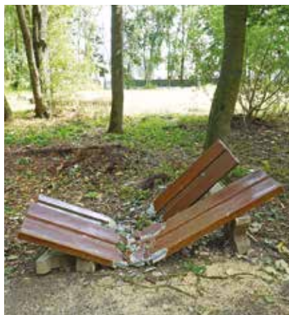
Un banc a été totalement détruit par la chute d'un arbre.

Le parc a été réouvert à l'issue des opérations, le 7 août. Il sera systématiquement maintenu fermé en cas d'intempéries.