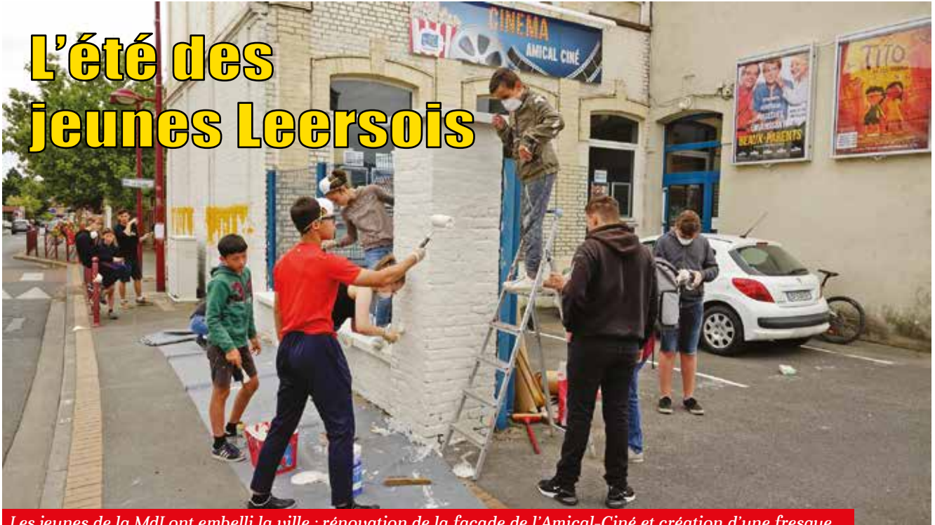
Les jeunes de la MdJ ont embelli la ville : rénovation de la façade de l'Amical-Ciné et création d'une fresque...

Lieux de découverte, d'échange et de dialogue, les accueils de loisirs et la Maison des Jeunes permettent aux 3-17 ans de profiter d'une multitude d'activités durant les grandes vacances.