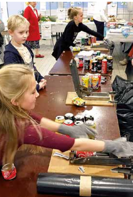
De jeunes bénévoles compactent les canettes récoltées lors du Téléthon 2018.