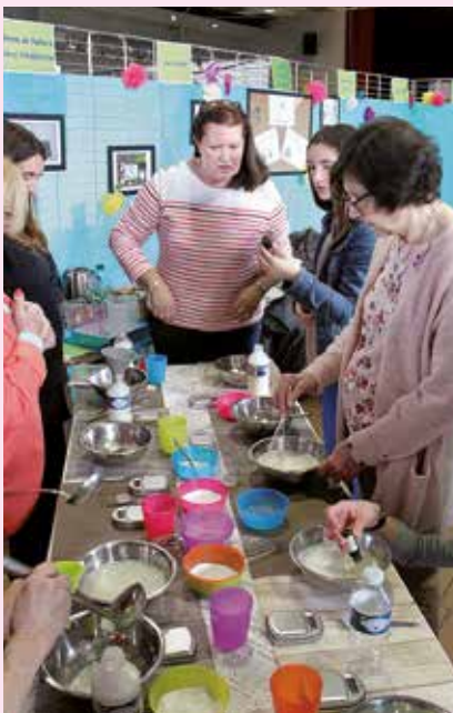
Apprenez, fabriquez et repartez avec votre produit naturel « fait maison ».

Venez avec vos enfants! Des animations ludiques sur différents stands, un concours de dessins sur le thème Un jardin extraordinaire , des jeux anciens et des châteaux gonflables seront au rendez-vous.