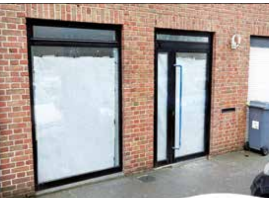
Le futur local est situé en centre-ville.

Retrouver une librairie dans notre commune était une demande des habitants depuis la fermeture de la Maison de la presse en 2010. C'était également une volonté de la municipalité qui, en vendant l'immeuble de l'ancienne halte-garderie, a trouvé une solution pour y recréer un commerce au rez-de-chaussée, et de préférence une librairie. Le nouveau propriétaire, entrepreneur en menuiserie, a respecté ses engagements et vient de terminer les travaux d'aménagement du local.