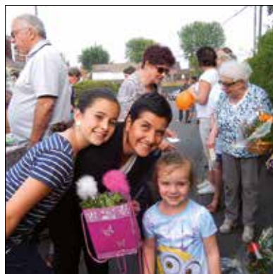
B Rue de Tournai