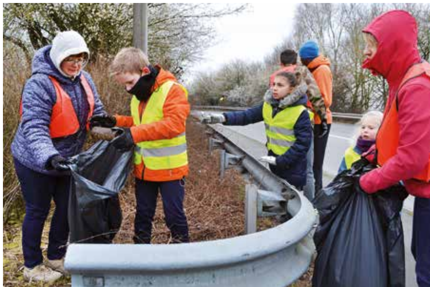
En 2018, près de 430 kg de débris ont été ramassés par des bénévoles durant la matinée. Quel sera le poids de la collecte cette année ?

Comme l'an dernier, la Ville de Leers s'engage dans l'opération « Hauts-de-France Propres, ensemble nettoyons notre région », le samedi 23 mars prochain.