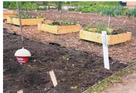
Une des parcelles pédagogiques

Mercredi 10 avril de 14 h 30 à 16 h Atelier jardinage / Atelier reporter : Que faisons-nous ? Pourquoi ? Comment ? Avec qui ?