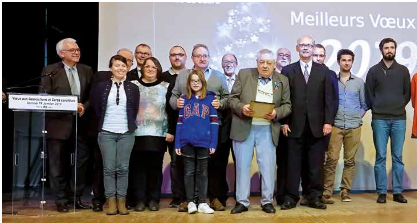
En clôture de cérémonie, tous les Leersois mis à l'honneur sont montés sur scène pour recevoir les applaudissements mérités du public.