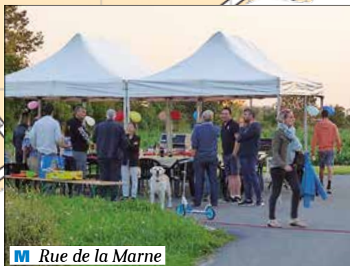
M Rue de la Marne