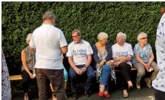
L'occasion de mieux connaître ses voisins en toute convivialité.