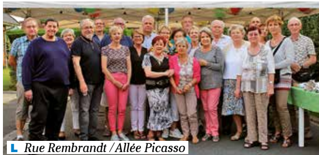
L Rue Rembrandt / Allée Picasso