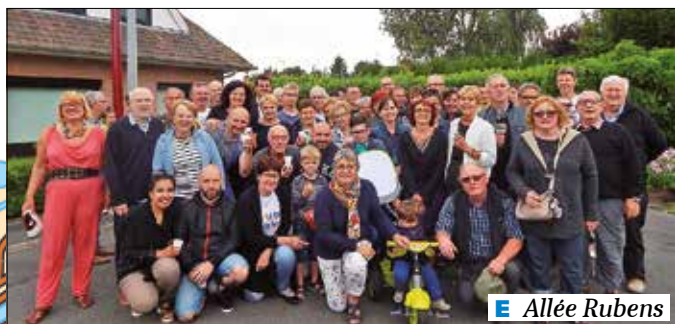
E Allée Rubens