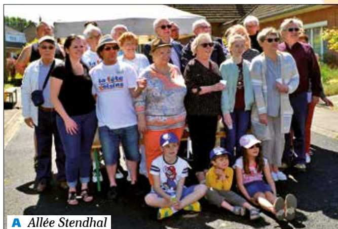
A Allée Stendhal

Pour en savoir plus, participez à la réunion d'informations Mardi 26 mars à 19h à l'Hôtel de Ville