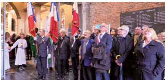
Après la messe du Souvenir, élus et associations sont venus se recueillir devant le retable des soldats leersois « Morts Pour la France » et ainsi en admirer la rénovation.