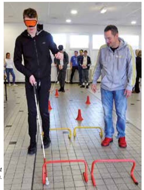
À l'atelier handicap, les jeunes se sont mis à la place des déficients visuels.

déroulés sous forme de jeux, de quizz ou d'exercices. Chaque élève avait la possibilité de participer à deux d'entre eux après tirage au sort d'un menu. À chaque édition, les jeunes se montrent particulièrement intéressés. Le forum leur permet d'échanger en toute liberté avec des adultes sur des questions qu'ils n'abordent pas forcément en classe ou à la maison. C'est aussi l'occasion de glaner informations et conseils pour une bonne hygiène de vie.