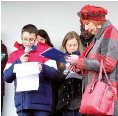
Les enfants du Conseil municipal des jeunes ont prononcé le nom des 30 soldats morts en 1918.