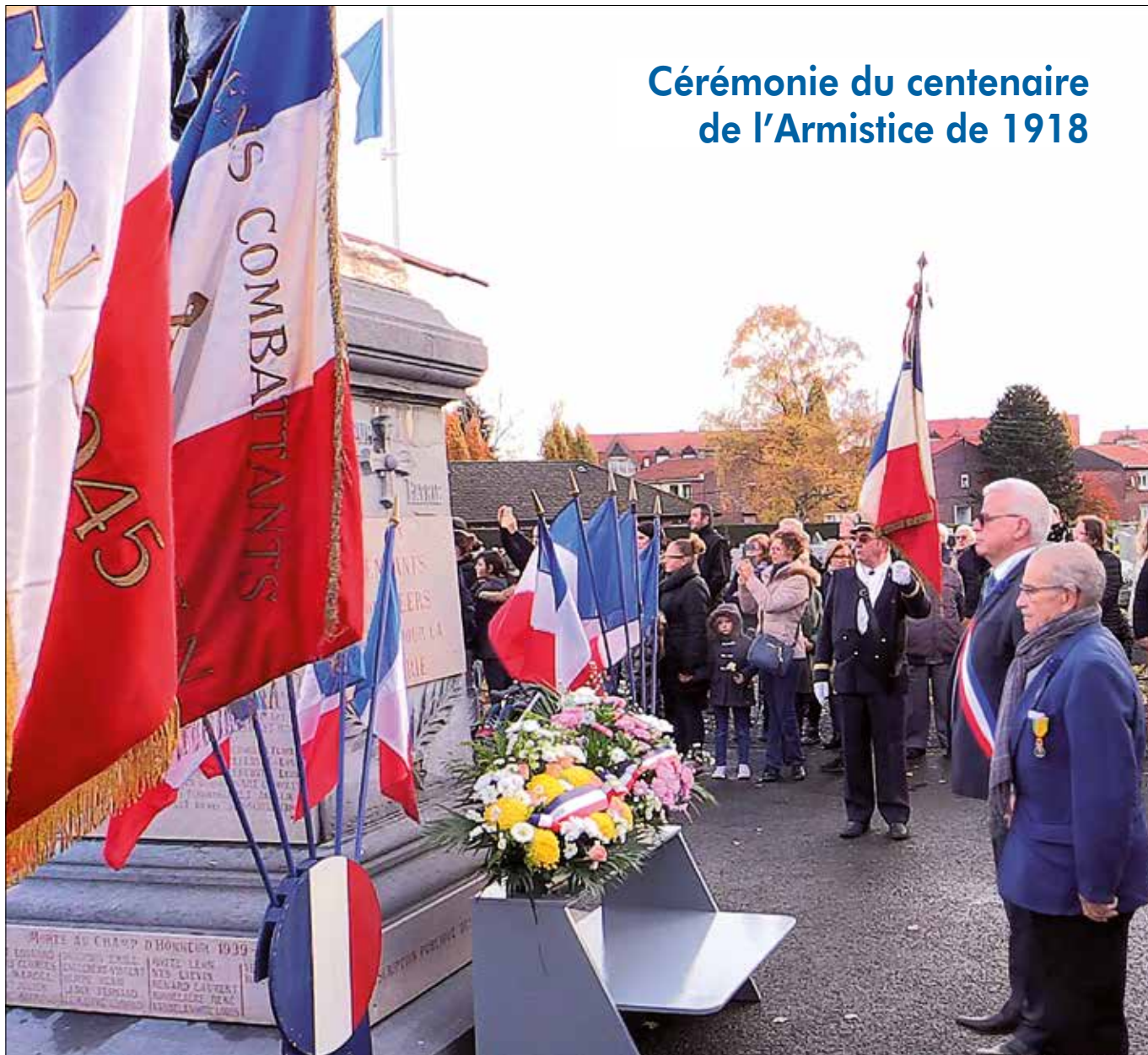
Cérémonie du centenaire de l'Armistice de 1918