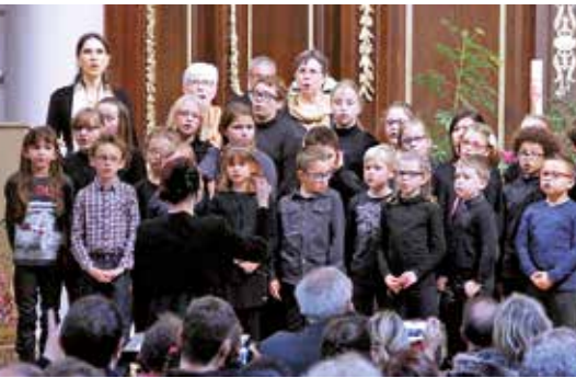
La classe de chant de l'École municipale de musique.