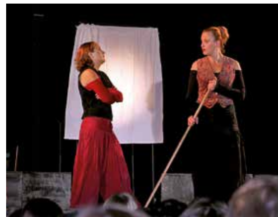
Un hommage émouvant, ironique, engagé aux femmes de 1914, par la compagnie Rémanences.