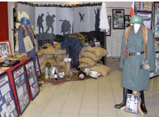
De nombreux objets, accessoires et costumes étaient présentés!