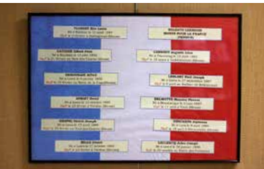
Les noms des soldats leersois « Mort Pour la France ».