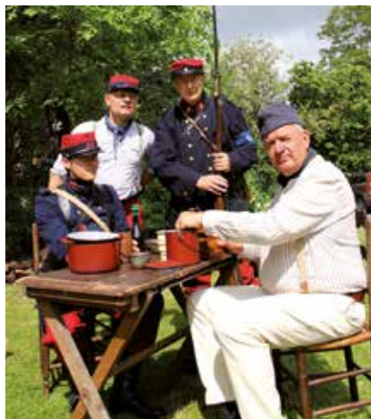
L'uniforme de l'armée française en 1914.