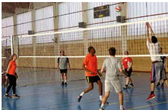
Parmi les animations sportives, le tournoi du LOS Volley-ball.

La plupart des salles municipales accueillait les animations sportives, culturelles ou musicales, les ventes diverses, repas, jeux... Merci aux bénévoles et aux Leersois pour leur générosité !