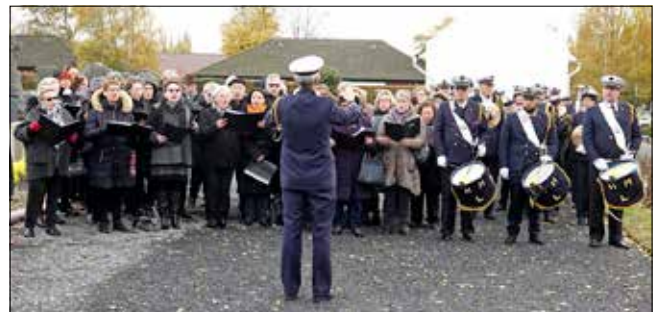
Accompagnée par l'Harmonie municipale, la chorale Le Diapason de Leers a interprété la marche historique Le Père la Victoire.