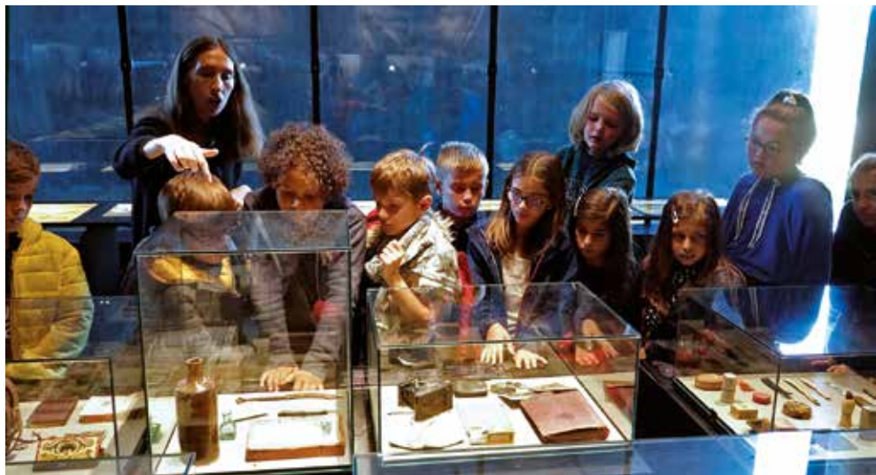
Visite avec un guide du nouveau musée Lens' 14-18 . Les murs de béton noir, une pénombre feutrée relevée d'un éclairage vif des vitrines inspirent respect et solennité.

place sont enterrés ici comme d'autres victimes de toutes les guerres. Cette sortie, qui s'est déroulée sous un soleil radieux, a permis aux élèves d'avoir une vision plus concrète de ce qui est étudié en classe et écrit dans les manuels.