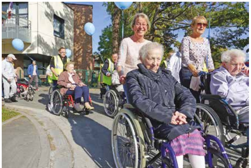
La « Marche bleue » dans la ville.