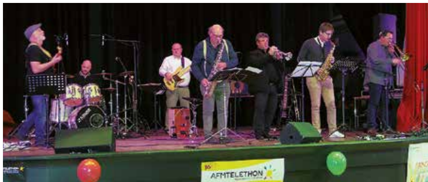
De nombreuses animations musicales se sont succédées durant tout le week-end. Ici, le groupe de rock « Carlencas ».

L'édition 2014 avait permis de récolter 8510 €, celle de 2016 de totaliser 9460 €. Les organisateurs espèrent faire mieux cette année. Ils peuvent déjà compter sur une somme de 8500 € mais il reste encore à comptabiliser. C'est le cas notamment pour la grande collecte de canettes vides qui seront recyclées par Récinov' pour l'aluminium. Au total 78 conteneurs ont été installés en divers points de la commune et beaucoup ont dû être vidés à plusieurs reprises.