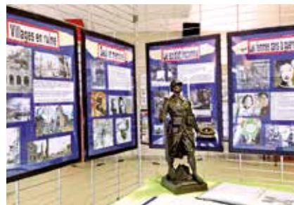
La Grande Guerre à travers la bande dessinée.

La Ville a le souci de se souvenir et de transmettre. Chaque année, elle associe les enfants au devoir de mémoire, lors de la journée à Notre-Dame-de-Lorette, mais aussi au concours du devoir de mémoire et aux rendez-vous patriotiques auxquels tous les Leersois sont invités à participer.