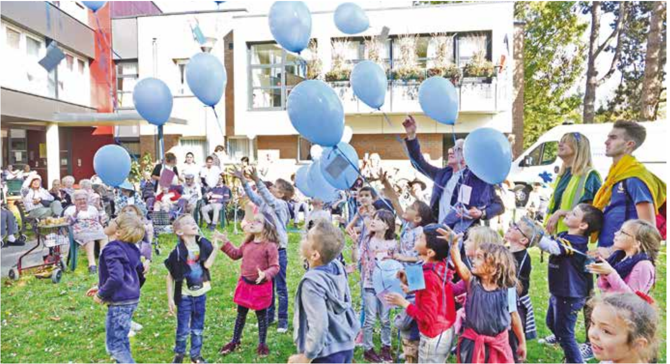
Lâcher de ballons bleus depuis l'ÉHPAD par les enfants des mercredis récréatifs.