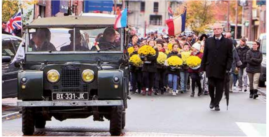
Parti de l'Hôtel de Ville, le cortège s'est rendu au monument aux morts, square du Général de Gaulle avant de rejoindre celui du cimetière Le Village. Trois jeeps du Rétro club Hémois l'ont accompagné.

Pour ce 100 e anniversaire, de nombreux Leersois se sont joints au cortège composé des enfants des écoles ou des associations, des enseignants, des jeunes du CMJ, des porte-drapeaux et des anciens combattants de l'UNC, des élus, des musiciens de l'Harmonie municipale, des chanteurs du Diapason de Leers et des membres du Jeep club hémois.