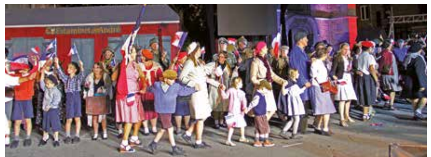
Le spectacle son et lumière Leers libérée .