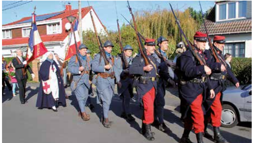
Défilé en costumes d'époque (avec l'évolution de l'uniforme français de 1914, devenu trop voyant).