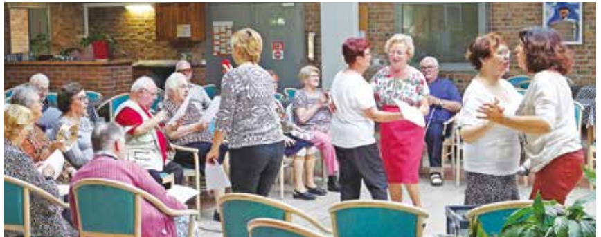
Atelier musical à la résidence Les quatre vents.

Elle s'est déroulée du 8 au 14 octobre et a permis aux aînés leersois de bénéficier d'un programme d'animations variées. Marche bleue, rencontre intergénérationnelle, lâcher de ballons, spectacle, concert, repas, jeux de société, atelier détente et bien-être, animation musicale... la plupart des activités était organisée à la résidence des Cygnes et à la résidence Les quatre vents . Pour les personnes âgées, cette semaine offre de belles occasions de sorties et de rencontres comme par exemple l'après-midi jeux de société avec l'ÉHPAD de Ronchin. Le SIDPA de Leers et les élèves infirmiers de la Croix Rouge ont animé certaines activités. Au niveau culturel, la Ville a offert à toutes les personnes âgées de plus de 67 ans la possibilité d'assister à la représentation théâtrale « Eune Salate Imaginaire » et à une séance de cinéma au choix, à l'Amical-Ciné.