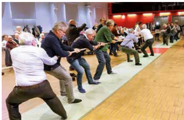
Bonne ambiance au tir à la corde pour affronter le Conseil municipal!

La plupart des salles municipales accueillait les animations sportives, culturelles ou musicales, les ventes diverses, repas, jeux... Merci aux bénévoles et aux Leersois pour leur générosité !