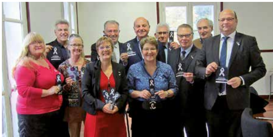
Les représentants des villes associées dans la lutte contre les violences faites aux femmes.