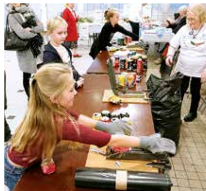
Gros succès pour la collecte des canettes et pour le défi « Compactage ».

L'édition 2014 avait permis de récolter 8510 €, celle de 2016 de totaliser 9460 €. Les organisateurs espèrent faire mieux cette année. Ils peuvent déjà compter sur une somme de 8500 € mais il reste encore à comptabiliser. C'est le cas notamment pour la grande collecte de canettes vides qui seront recyclées par Récinov' pour l'aluminium. Au total 78 conteneurs ont été installés en divers points de la commune et beaucoup ont dû être vidés à plusieurs reprises.