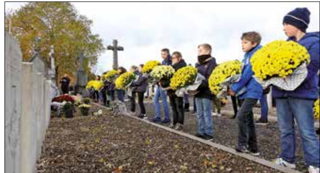
Les enfants ont déposé des gerbes sur la tombe des soldats leersois « Morts pour la France ».