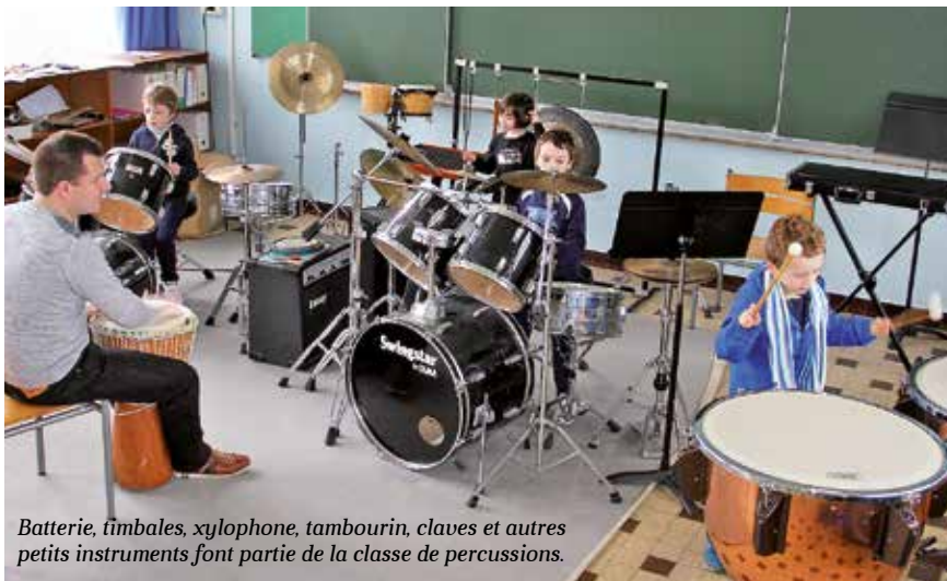
Batterie, timbales, xylophone, tambourin, claves et autres petits instruments font partie de la classe de percussions.

Les cours collectifs d'éveil musical accueillent les enfants de 5 et 6 ans. Cette année, ils sont complétés par un parcours Découvertes ouvert aux élèves qui auront 7 ans à la rentrée prochaine, et pourront intégrer le premier cycle d'apprentissage. Afin de leur faciliter le choix d'un instrument, les professeurs offrent la possibilité aux élèves d'assister par petits groupes à des séances où ils peuvent voir, écouter et surtout essayer les différents instruments. Ce parcours se déroule de mars à mai.