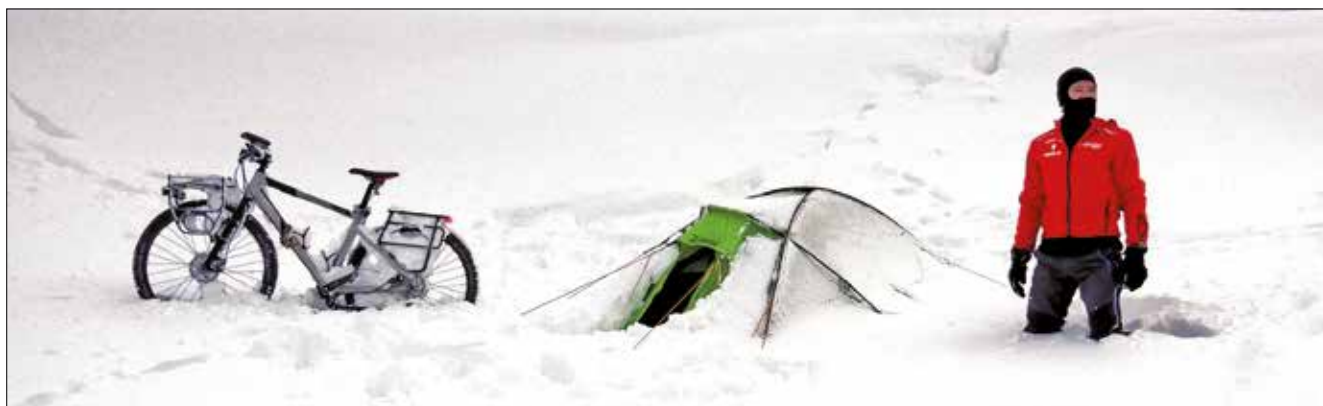
Destinations insolites, conditions climatiques difficiles... l'Islande n'est pas un pays comme les autres et le vélo n'est pas le mode de transport le plus répandu, surtout en hiver!

Et il ne s'arrête plus ! En juillet prochain, notre aventurier s'attaquera à la Birmanie avant de quitter Leers pour un demi-tour du monde fin 2019 ou début 2020.