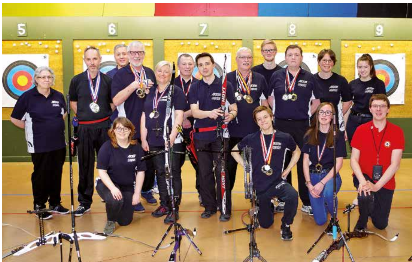
L'équipe complète des compétiteurs du LOS Tir à l'Arc.

C'est une année exceptionnelle que vit le LOS Tir à l'arc. Avec 67 podiums sur 139 participations aux compétitions en salle et les 1 ère et 3 e places de la finale départementale par équipe, le club de Leers fait figure de modèle dans le Nord. Merci aux adhérents, entraîneurs et bénévoles et bravo à tous les champions qui portent haut les couleurs du club :