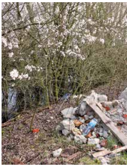
Au printemps, la nature fleurit... et les dépôts sauvages aussi!

- Respecter le tri sélectif des déchets - Demander un Pass' Déchèteries auprès d'Esterra et déposer ses déchets encombrants à la déchèterie - Ramasser les déjections de son animal. La propreté est l'affaire de tous, merci de nous aider à garder la ville propre et agréable à vivre.