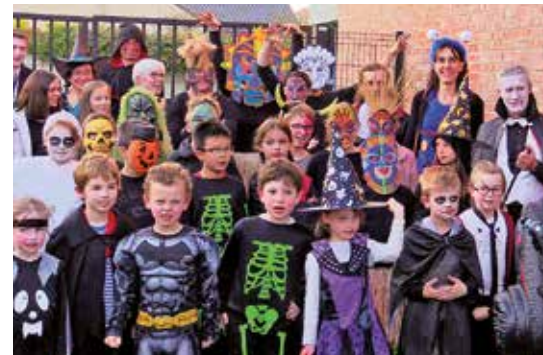
L'audition de musique a eu un succès « monstre »!

Si mardi 17 avril, la salle du centre était envahie de dizaines de monstres, petits et grands : pas de panique! C'était juste l'audition « Monstre » de l'École municipale de musique. Professeurs et élèves des classes d'instruments et de chant ont « joué » le jeu en interprétant des morceaux de films fantastiques comme Harry Potter , Ghostbusters , la famille Adams ... Et la classe d'éveil musical n'était pas en reste avec des petits chants effrayants mais... rigolos!