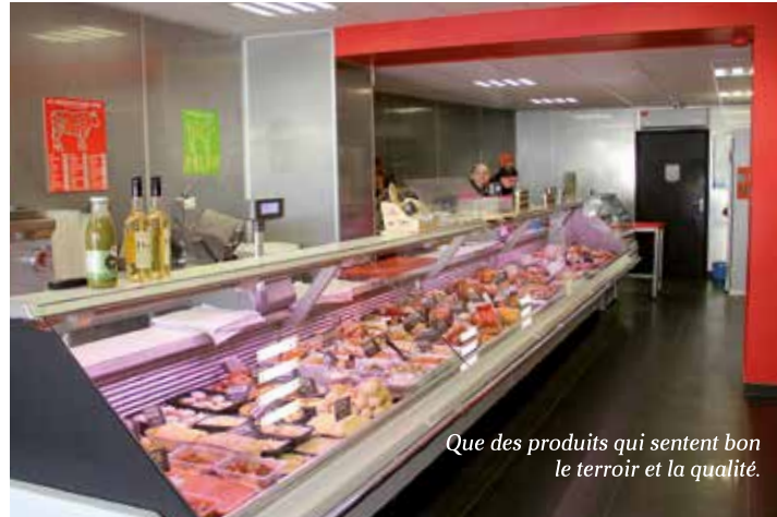
Que des produits qui sentent bon le terroir et la qualité.

tir 80 % de fabrication maison, soit, 80 % de viande en carcasse que nous devons désosser et transformer pour la vente » poursuit-il. En quantité, cela représente une tonne chaque semaine et deux viandes sur quatre doivent être issues de la production locale. Le porc et le bœuf (charolais, rouge des prés, blonde d'Aquitaine...) proviennent de la région. L'agneau, le veau du Limousin, les volailles des Landes sont d'origine 100 % française. La boucherie du Centre, c'est aussi un large choix de plats cuisinés et de la charcuterie maison : demandez le saucisson à l'ail ou le pâté du chef... et venez tester la carte traiteur.