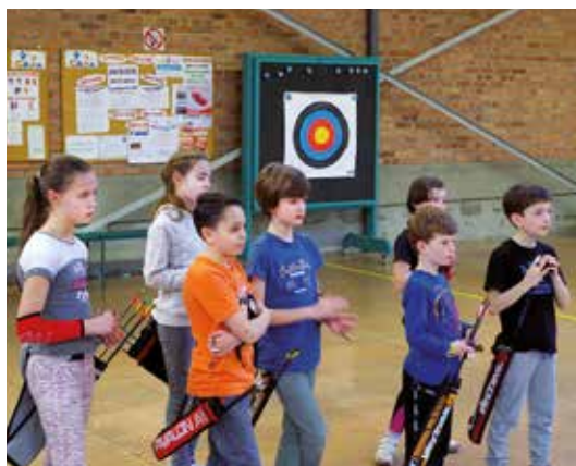
La jeune garde est là, prête à décrocher des médailles!